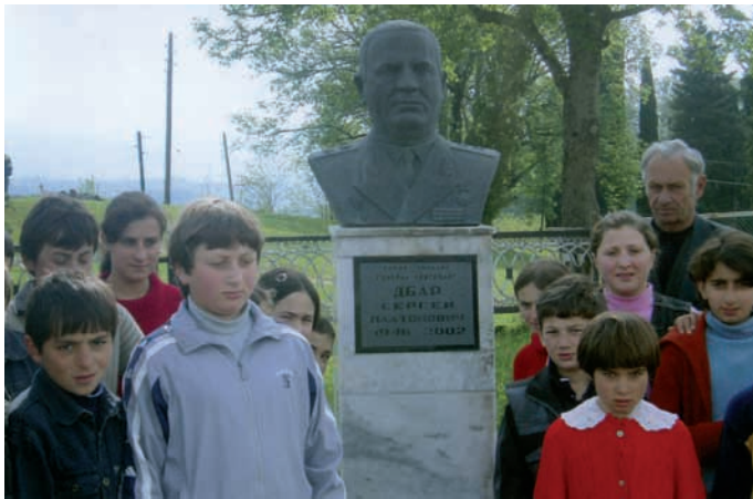
Сергеи Дбар иқыта гәакыа Мгәызырхәа игылоу абака