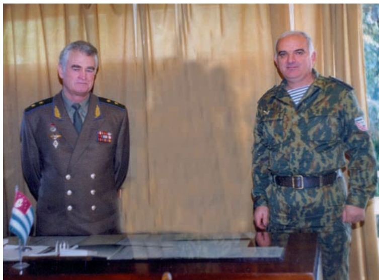
Султан Сосналиеви Сергеи Дбари