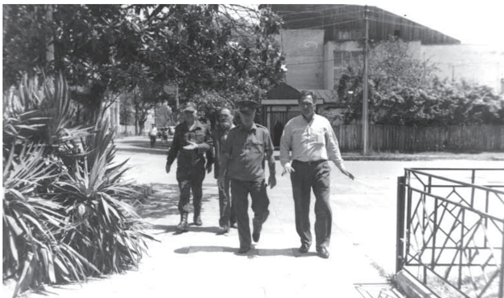
Атһсны Ацһынцтэылатэ еибашьра амузеи анаадыртуаз (ақ. Гэдоутә)