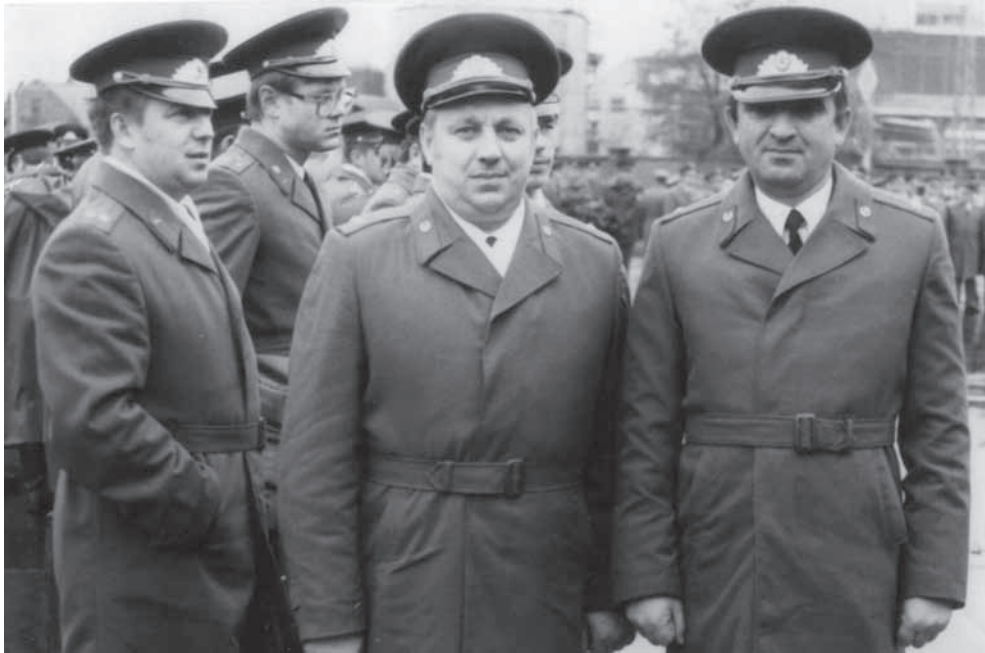
Германия. Сергей Дбар аррамайура данахысуаз