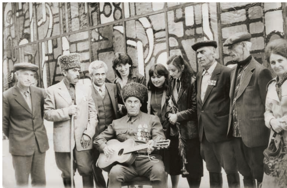
«Афырхайҗара ыzzом» захьзыз аиҗылара иалахэыз — 1983 ш. (алабашья зку Платон Дбар иоуп)