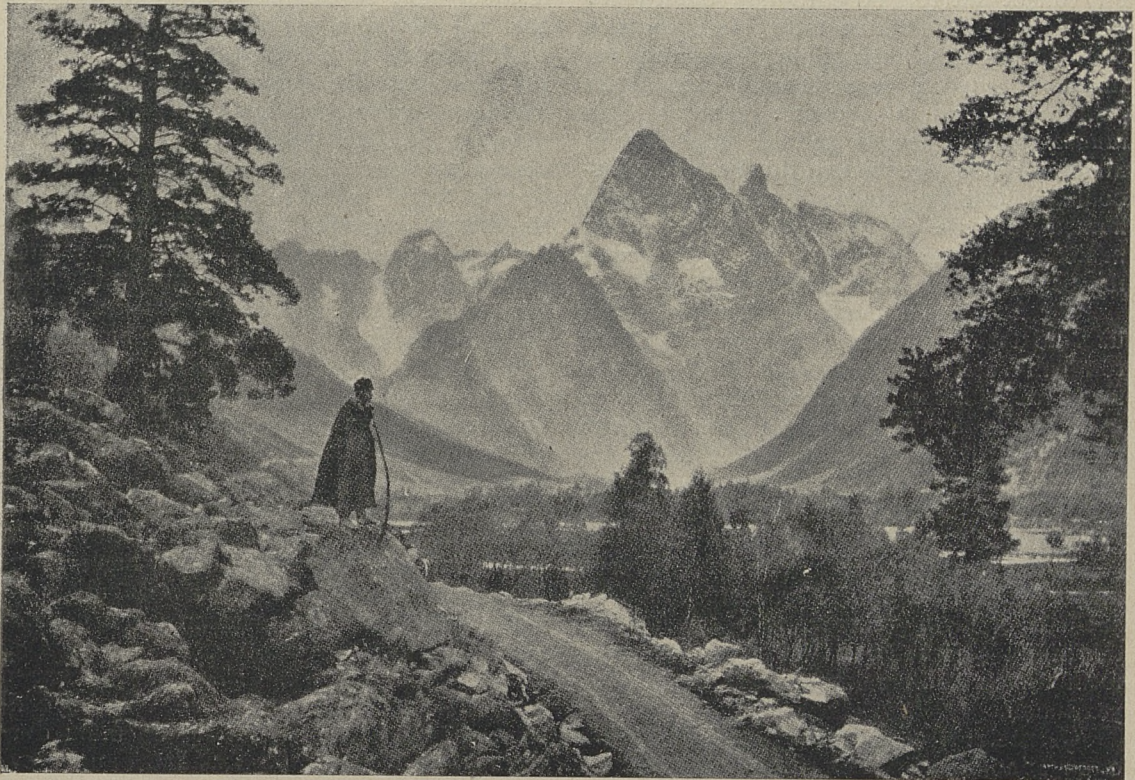
GARBİ ADIGE'DE ÇATÇA DAĞI