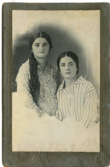
Сергеи Дбар иан Ғалба Хьмор Хасан-иҗа (игылоу)