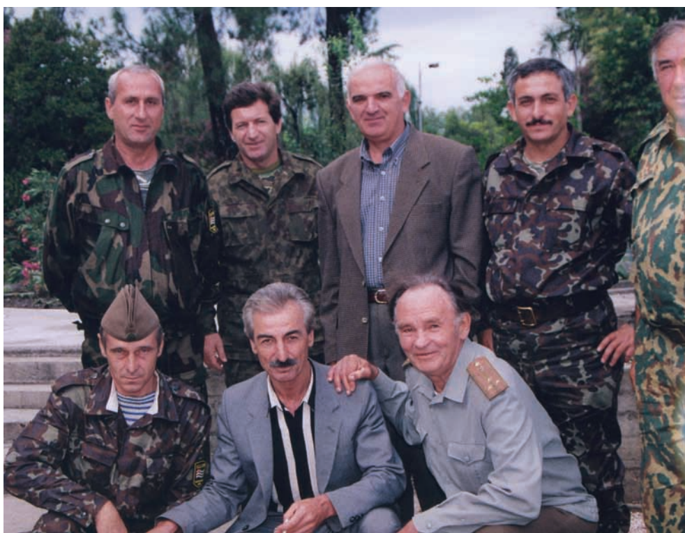
Сергеи Дбар гәытәык ифызцәеи иарей