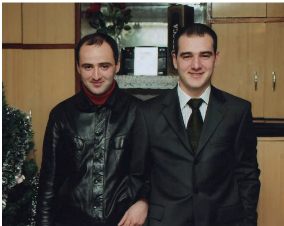
Аишьцэа Дениси Дмитрии