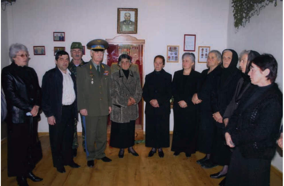
Гәдоутәтәи амузеи ахыбрағы