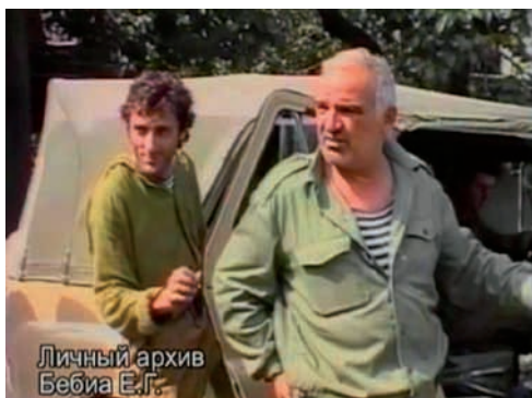
Агазетъ «Амцахара» архив ақынтә