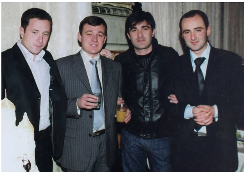
Зеггы рзы згэы былуаз, Денис...