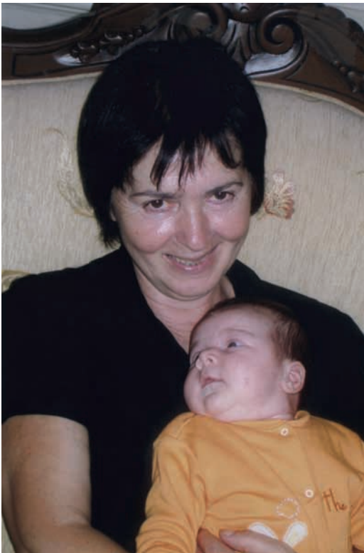
Дбар Роза — Сергеи иаҳэшья. (Дылкуп Сергеи имотә Анастасиа)