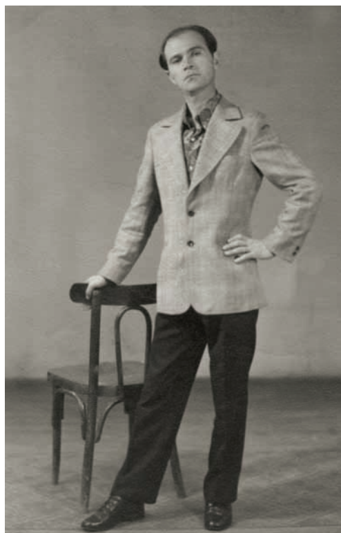
Сергеи иашьа Алиоша Дбар