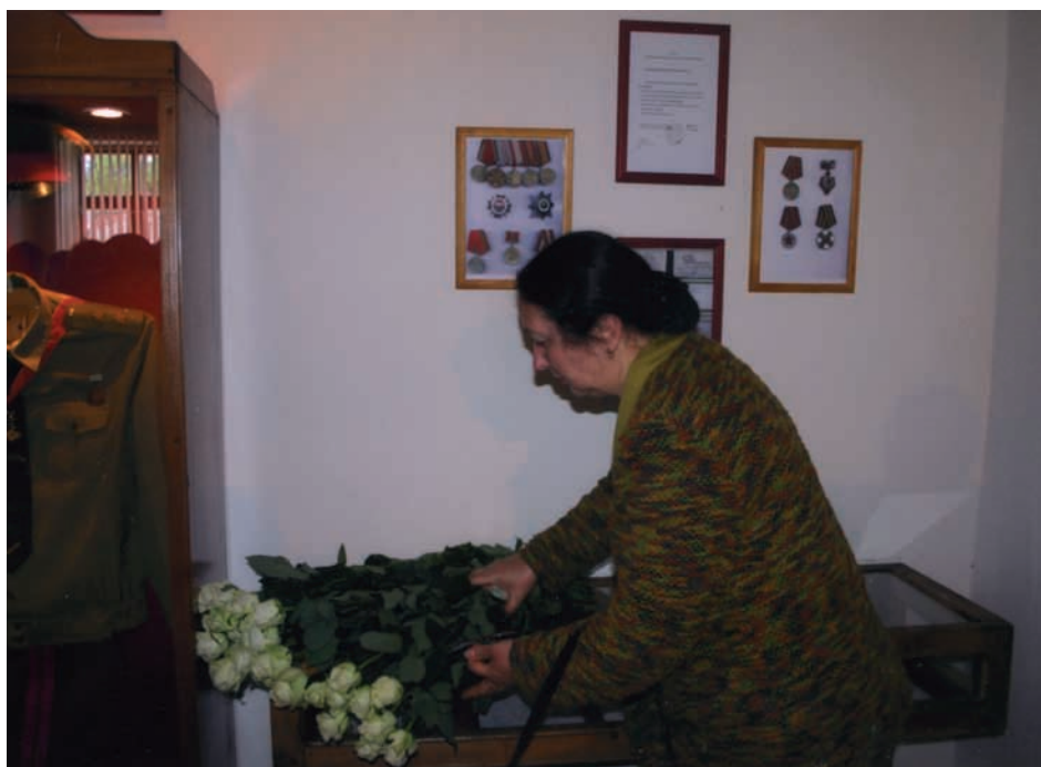
Султан Сосналиев иңшәма Лиуба Сосналиева Сергеи Дбар ихъз зху амузеи ағы