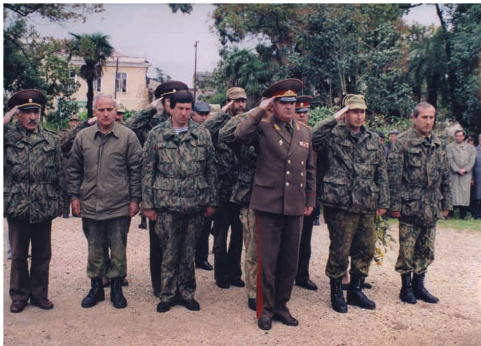
Сергеи Дбар и ыбызцэеи иареи тҕахаз айбашыцаа рбака аҕаҕыа