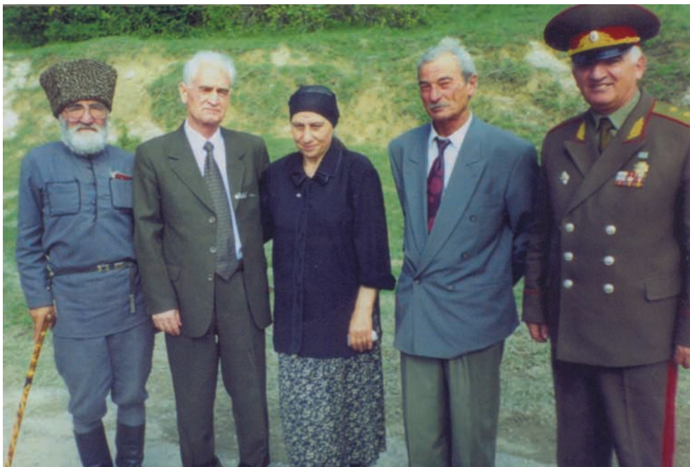
Аибашыра ахым җапысуаз атытқда ратара