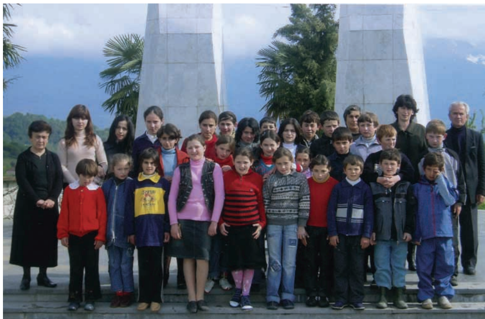
Сергеи Дбар ицъабаа зду ит̄ахаз Мг̄эызырхэаа рба̄ка аґаг̄хьа