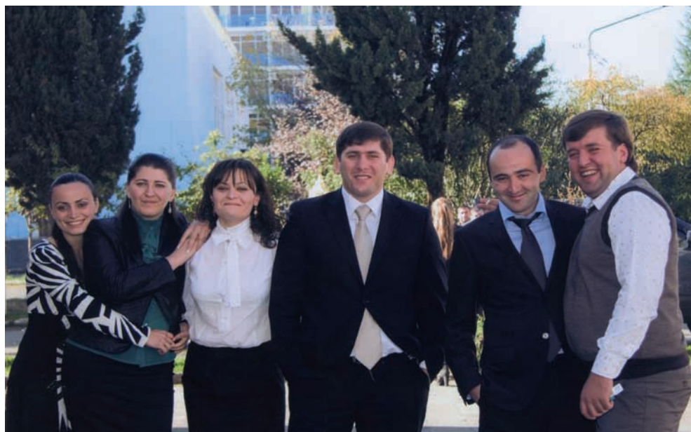
Аччарей ахамаррей згымыз