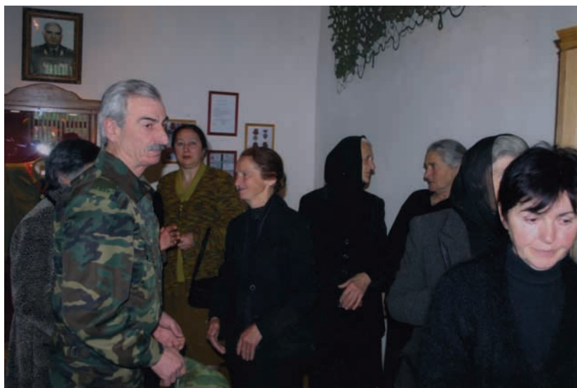
Г̄доут̄ат̄аи амузеи Сергеи Дбар их̄вз анахьр̄ц̄оз