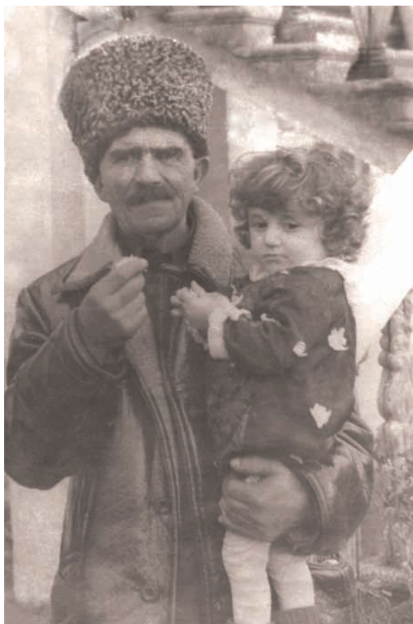
Сергеи иаб Платон