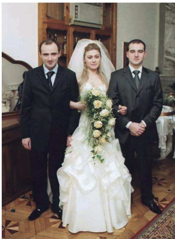
Денис Дбари, итаца Анқабтха Саидеи, иашья Дмитрии