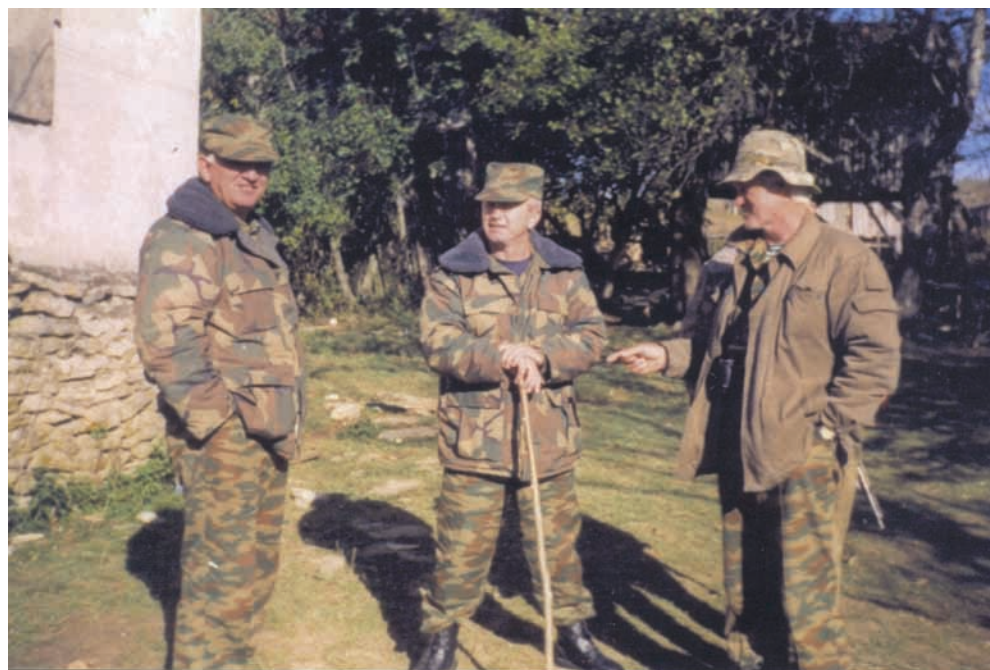
Аибашьра ашьтахьтәи амиқәа раан