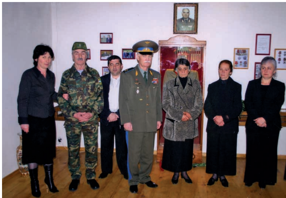
Атӑсны Ацӑынцӑтӑылатӑ еибашӑра Гӑдоутӑтӑи амузеи Сергеи Дбар ихӑз анахырӑоз