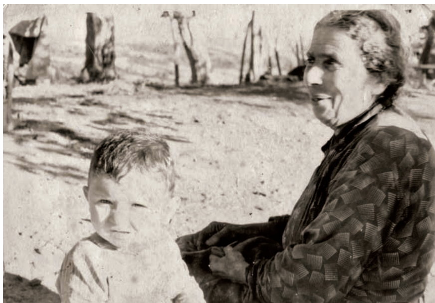
Сергеи Дбар ианду Шъааиза Жытџа