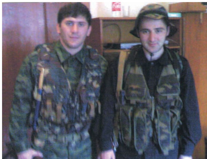
Есьмиша иеицыз аифыцэа