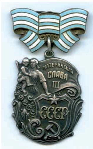
Сергеи ианду Шьяаиза иланашьаз амедал «Ан афыртыҕаыс»