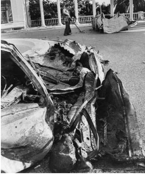
Mayın'ın eseri görüntüler