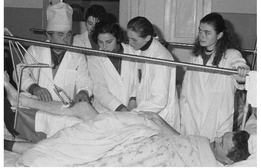
Kızlar bayatın, savaşın her alanında... Hastanelerde... Tanklarda....