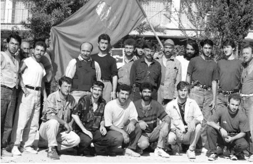
Özgürlük Savaşçıları Uğrılama...