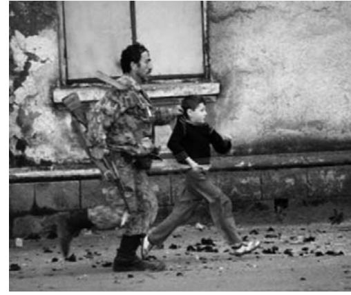
Çocuklar her yerde aynı...