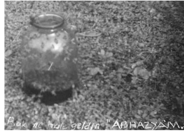
Arılar bile aç ve perişan balde kaldılar... Ne hale geldin Abbazya'm...