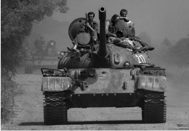
Bizim de tanklarımız vardı